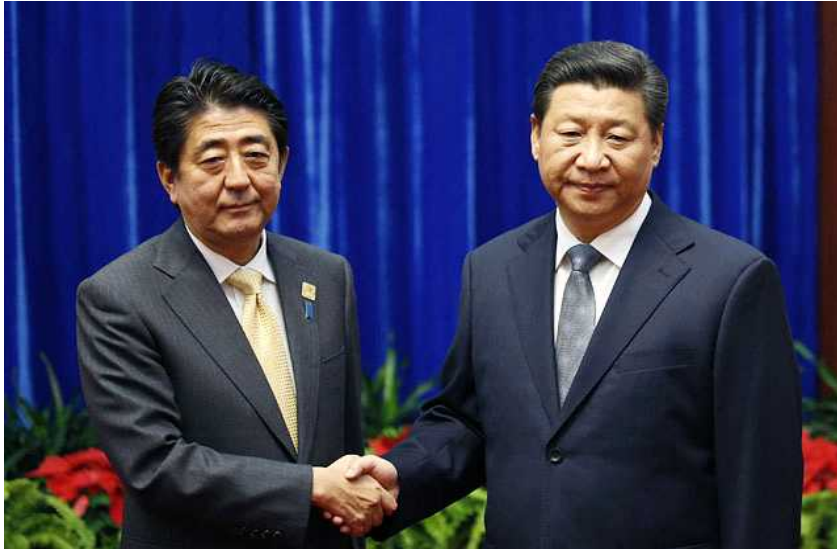
[그림 4] 2014년11월10일 오전(현지시각) APEC계기 중일 정상회담이 열렸다. 사진은 회담 전 악수하고 있는 시진핑(오른쪽) 중국 국가주석과 아베 신조 일본 총리

그렇다고 해도 삼국은 한중일 간 관계가 부드럽게 발전하는데 많은 경제적인 이익을 볼 수 있다고 잘 인식하기 때문에 갈등으로 인한 문제를 합리적으로 해결하려는 시도를 여러 번 하였다. 50년대부터 현재까지 영토 분쟁이 무장 대립 상태에 이르지 않도록 애썼는데 한일 및 중일 현 관계가 아무리 악화되어도 최근에 동중국해에서 긴장이 고조된 상황을 완화시키기 위한 노력도 볼 수 있다. 역사를 본다면 한중일 간 관계는 영토 분쟁을 완전히 해소시키기에는 적당한 신뢰의 수준까지 끌어올릴 수 없었지만 이들 갈등에 대한 문제를 해소시킬 사례를 충분히 찾을 수 있다.