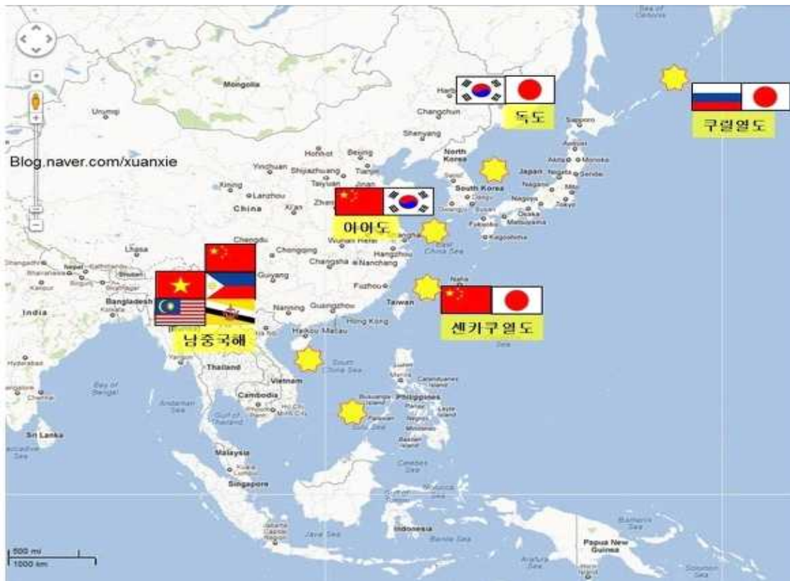
[그림 2] 한중일 간 영토 분쟁을 포함한 동아시아 주요 영토 분쟁 지역

최근에는 동중국해에서 한중일 영토 분쟁으로 인해 긴장이 고조되었다. 그 이유는 중국이 동해 방공식별구역을 설정했기 때문이다. 이 방공식별구역에는 분쟁의 대상인 다오위다오/센카쿠 열도와 이어도/쑤옌자오 24) 를 포함했다. 25) 방공식별구역의 설정 시부터 아직까지 여러 나라 군용 비행기들이 이 구역 상공을 날았으나 중국 당국이 아무런 무력적인 태도를 보이지 않았지만 26) 중국과 일본의 관계는 한층 더 악화되었다. 27)