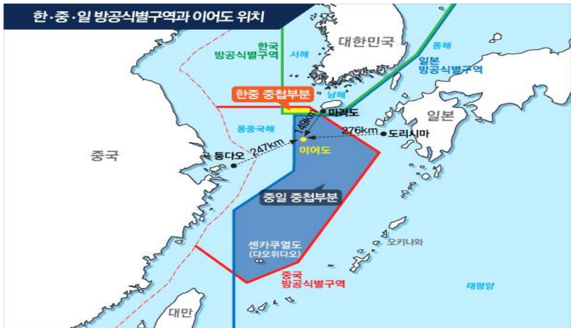
[그림 3] 한중일 방공식별구역

영토 분쟁들 외에는 다른 역사적인 갈등과 그 문제에 대한 일본의 입장도 한중일 간 관계의 발전 과정에 난관을 만든다. 이 역사적인 갈등은 이토 히로부미 저격 사건, 위안부 문제, 난징 대학살의 역사적 평가에 대한 이견 및 야스쿠니 신사 참배 문제 등이다: